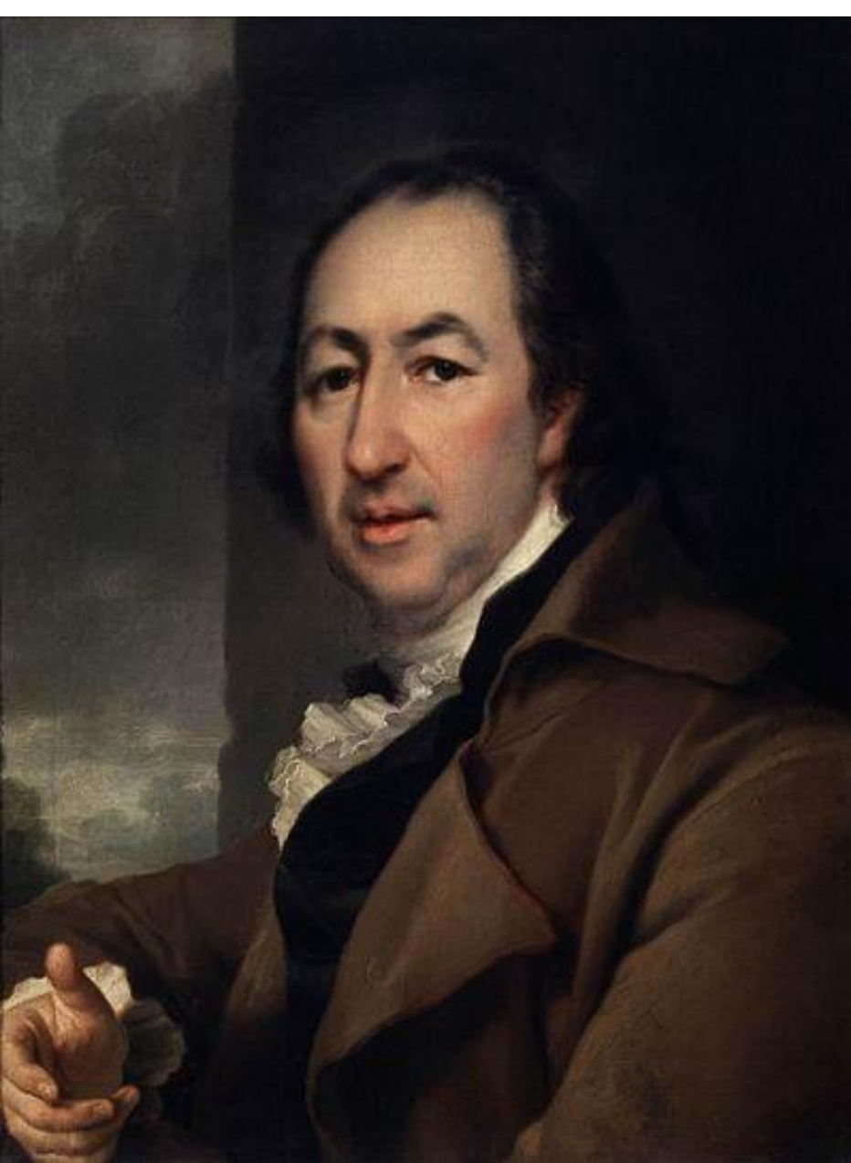
Николай Иванович Новиков